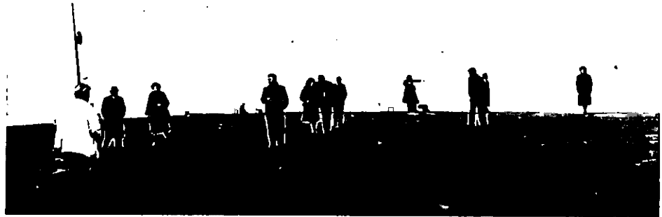
Le Voyage des comédiens (O Thiasos).

Avec le plan fixe et l'unicité du point de vue, quelque chose échappe toujours. La vision est partielle, la compréhension jamais assurée. Pas d'avance sur l'Histoire. Pas de recul non plus.